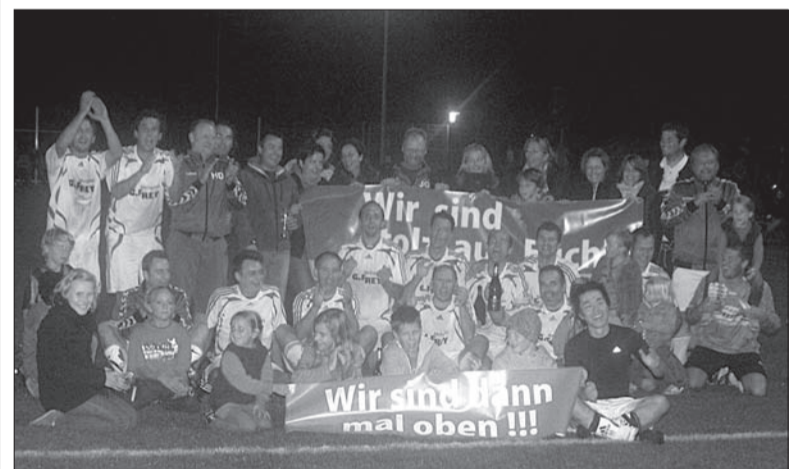
Wir sind dann mal oben - tolle Leistung!